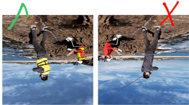
• اطلب رقم الطوارئ (000) للمساعدة إذا سقط أي شخص في الماء، لا تلحق به! • استمع إلى تنبؤات الطقس أو اتصل بخط معلومات الطقس على الرقم 1900 937 107 للحصول على التحديثات.